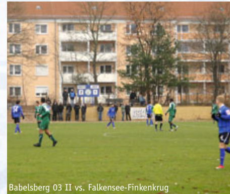
Babelsberg 03 II vs. Falkensee-Finkenkrug