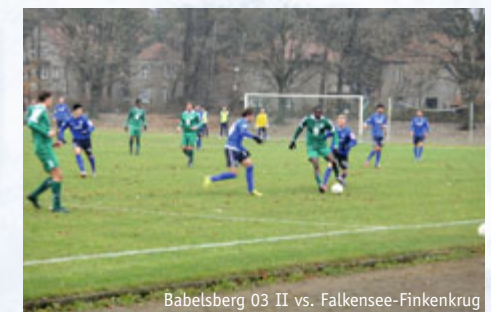
Babelsberg 03 II vs. Falkensee-Finkenkrug

drei magere Pünktchen und im freien Fall ging's in den Tabellenkeller. Schlechter steht im Moment nur noch der 1. FC Frankfurt, weder Fusion noch Trainerwechsel konnten bisher an der Oder für Besserung sorgen. Weiter im Ligaalltag geht es an diesem Wochenende, die Zweete empfängt dabei zum letzten Heimspiel des Jahres am morgigen Sonntag um 13 Uhr an der Sandscholle den FC Schwedt und freut sich wie immer über zahlreiche Unterstützung.