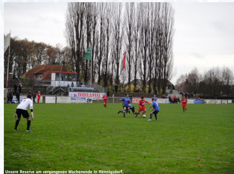
Unsere Reserve am vergangenen Wochenende in Hennigsdorf.